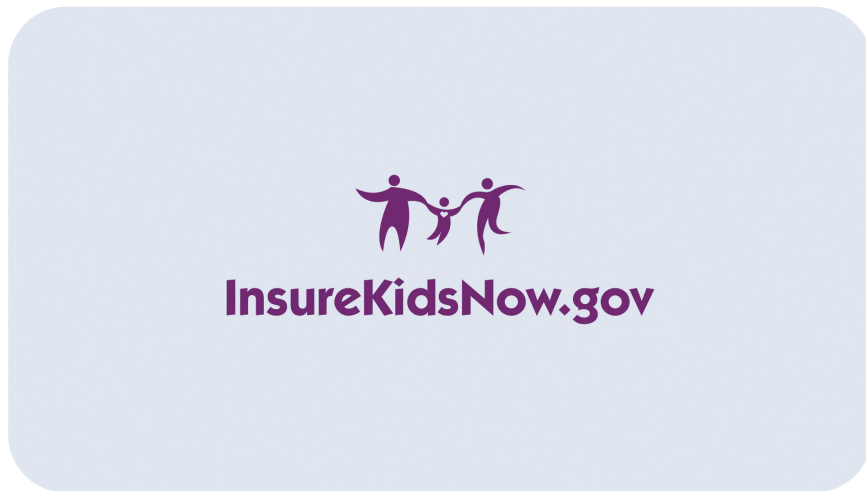
SUPER: InsureKidsNow.gov. Empezamos con el logotipo de InsureKidsNow.gov.