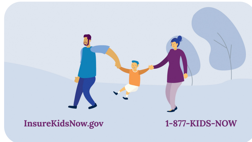
SUPER: InsureKidsNow.gov 1-877-KIDS-NOW Se ve una familia en forma del logotipo de InsureKidsNow.gov caminando afuera. VO: Medicaid y CHIP ofrecen cobertura médica gratuita o a bajo costo para niños y adolescentes.