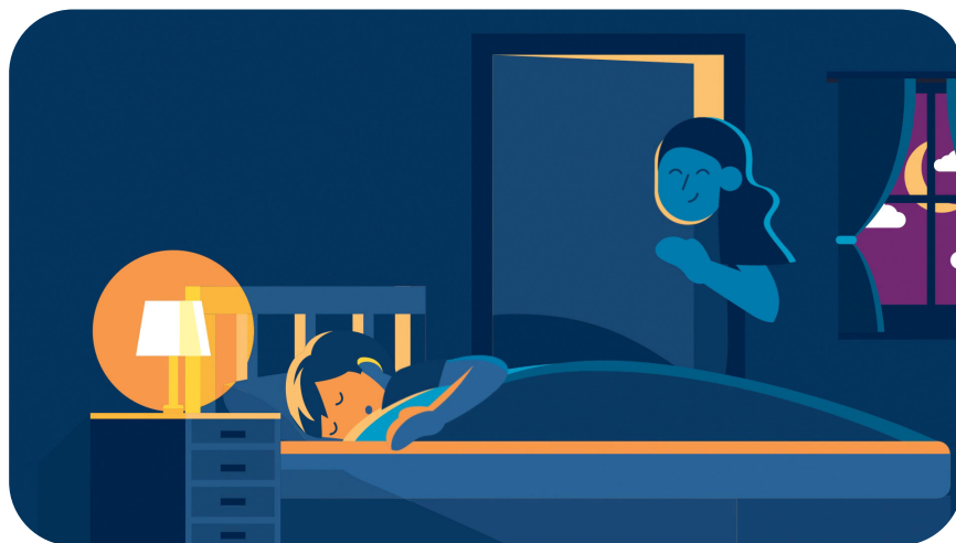
Una mamá vigila a su hijo durmiendo. VO: Inscríbase hoy.