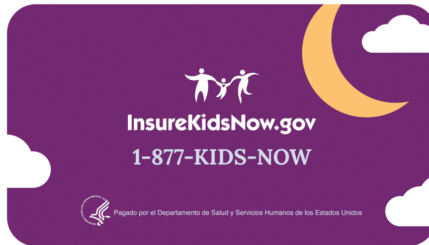
SUPER: InsureKidsNow.gov 1-877-KIDS-NOW Pagado por el Departamento de Salud y Servicios Humanos de los Estados Unidos VO: Infórmese en InsureKidsNow.gov. Pagado por el Departamento de Salud y Servicios Humanos de los Estados Unidos.